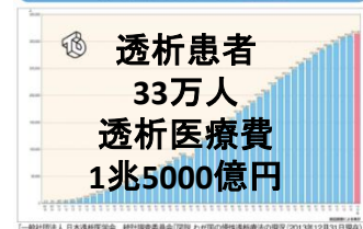
(1) 慢性透析患者数の推移 (図表2)